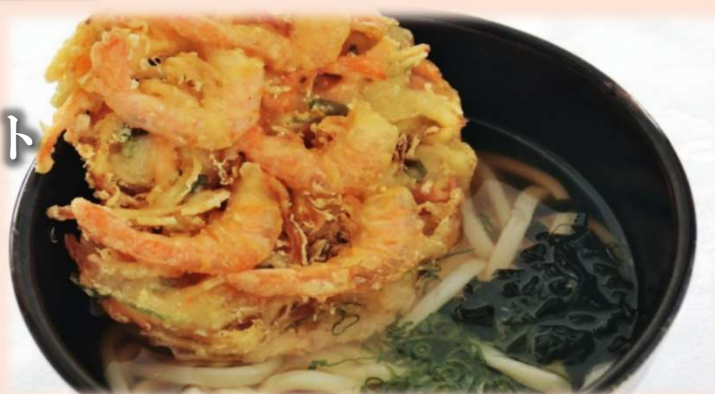
かき揚げうどん(そば)セット 〈ごはん付〉 1350円 (税込) 単品1200円 (税込)