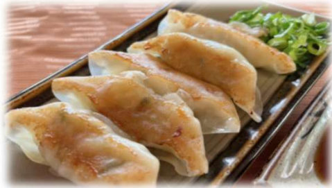
・ぎょうざ (5個) 550円 (税込)