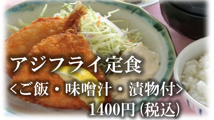
アジフライ定食 〈ご飯・味噌汁・漬物付〉 1400円 (税込)