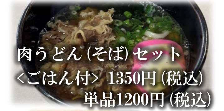
肉うどん(そば)セット 〈ごはん付〉 1350円 (税込) 単品1200円 (税込)