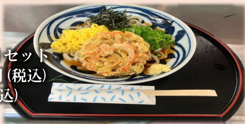
ぶっかけうどん(そば)セット 〈塩ぶすび付〉 1400円 (税込) 単品1200円 (税込)