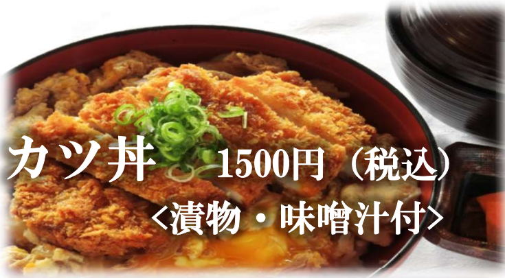
カツ丼 1500円 (税込) 〈漬物・味噌汁付〉