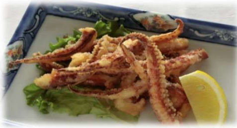
・いか下足唐揚 650円 (税込)