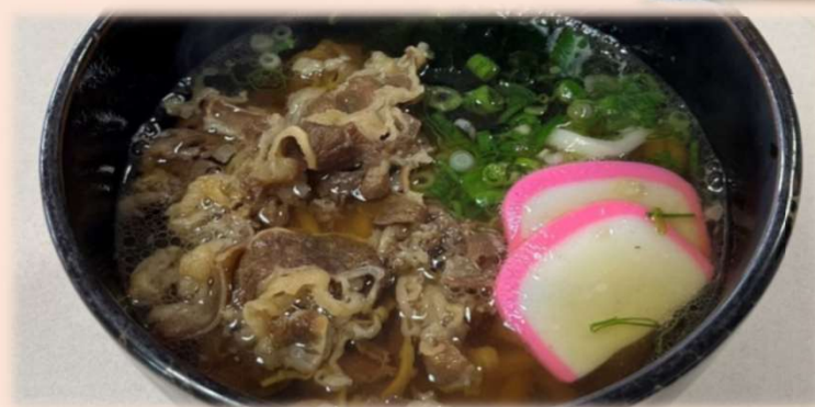
肉うどん(そば)セット 〈ごはん付〉 1350円 (税込) 単品1200円 (税込)