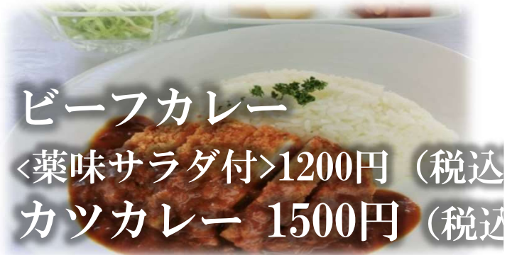
ビーフカレー 〈薬味サラダ付〉1200円 (税込) カツカレー 1500円 (税込)