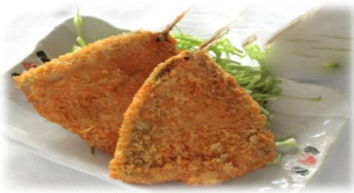
・アジフライ 900円 (税込)