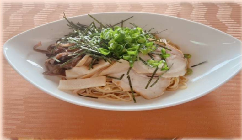
混ぜそばセット 〈ごはん付〉 1350円 (税込) 単品1200円 (税込)