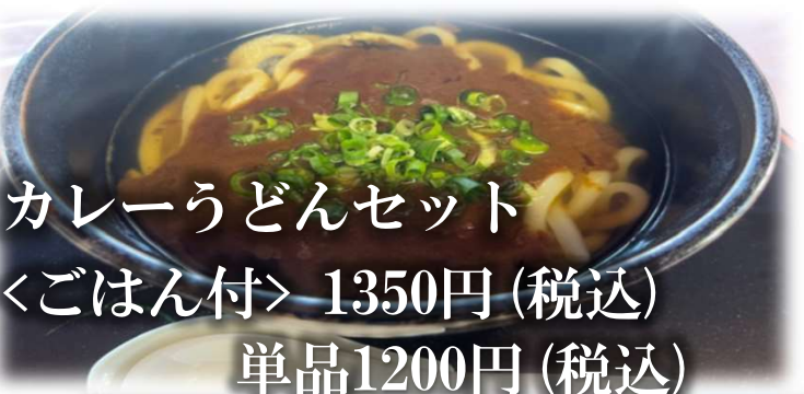
カレーうどんセット 〈ごはん付〉 1350円 (税込) 単品1200円 (税込)