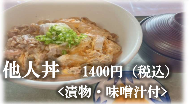
他人丼 1400円 (税込) 〈漬物・味噌汁付〉