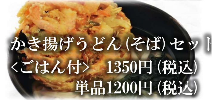
かき揚げうどん(そば)セット 〈ごはん付〉 1350円 (税込) 単品1200円 (税込)