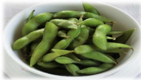
・枝豆 500円 (税込)